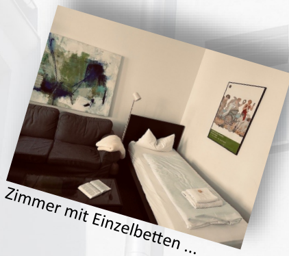
Zimmer mit Einzelbetten ...