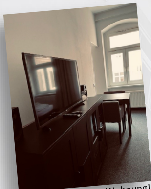
Flat-Screen in jeder Wohnung!

In einem von wunderschönen Altbauten geprägten typischen Kiez in Berlin-Mitte bieten wir in ruhiger, verkehrsgünstiger Lage unsere gemütlichen Wohnungen an.