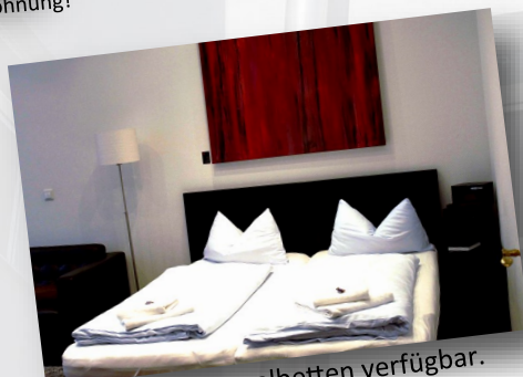
... oder mit Doppelbetten verfügbar.

Bitte fragen Sie uns gerne nach den regelmäßig angebotenen „Specials“! Besonders im Herbst, Winter und Frühjahr.