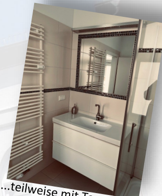
...teilweise mit Tageslicht!